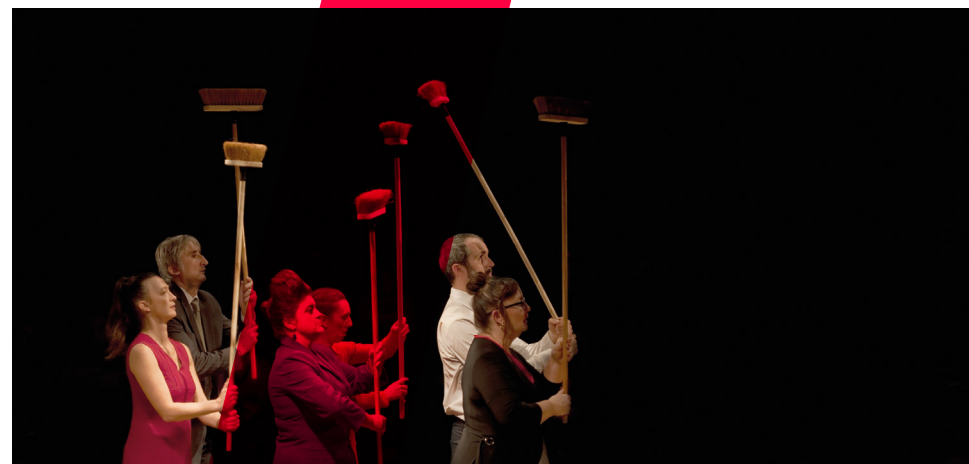
L'Effet fin de siècle.